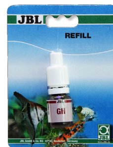
JBL Test GH Test rapide pour déterminer la dureté totale