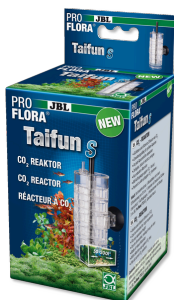
JBL PROFLORA Taifun S Diffuseur de CO2 extensible pour petit aquarium