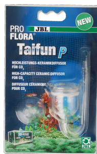
JBL PROFLORA Taifun P Mini-diffuseur de CO2 pour nano-aquarium d'eau douce