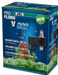
JBL PROFLORA v002 Électrovanne silencieuse