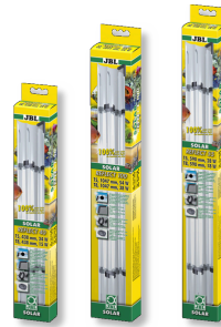
JBL SOLAR Reflect T5/T8 (895-1500 mm) Réflecteur pour tube fluorescent SOLAR