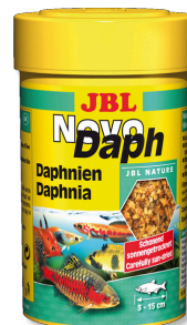
JBL NovoDaph Puces d'eau, friandises pour poissons d'aquarium