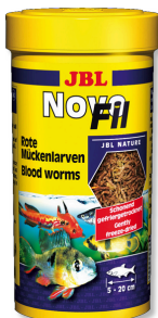
JBL NovoFil Larves de moustiques rouges pour poissons d'aquarium