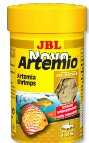
JBL NovoArtemio Complément d'artémias pour tous poissons d'aquarium