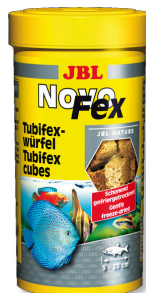
JBL NovoFex Cubes de tubifex, friandises pour poissons d'aquarium