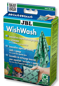
JBL WishWash Lavette et éponge