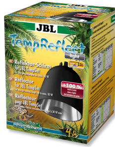
JBL TempReflect light Réflecteur pour lampes basse consommation