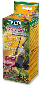
JBL TempSet angle+ connect Kit d'installation pour spot de terrarium