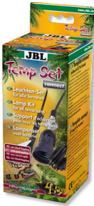
JBL TempSet connect Kit d'installation avec connecteur