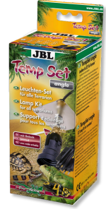
JBL TempSet angle Kit d'installation pour spot de terrarium