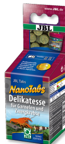
JBL NanoTabs Aliment de base pour crevettes et écrevisses naines