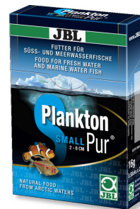
JBL Plankton Pur SMALL Friandises pour petits poissons d'aquarium