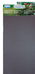
JBL AquaPad Tapis spécial pour aquarium ou terrarium