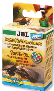
JBL Soleil Tropic Aqua

Vitamines pour tortues d'eau et de marais