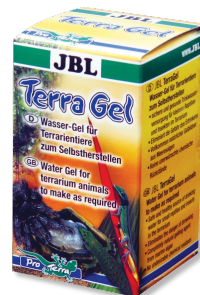
JBL TerraGel Gel aqueux pour animaux de terrarium