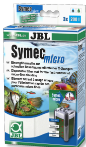
JBL Symec micro Microfibre pour filtre d'aquarium contre l'eau turbide