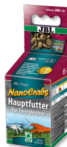
JBL NanoCrabs Aliment de base pour écrevisses naines