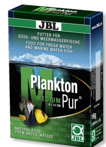
JBL PlanktonPur MEDIUM Friandises pour grands poissons d'aquarium