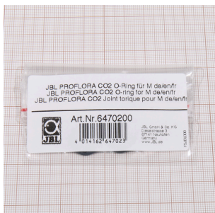
JBL PROFLORA CO2 уплотн. кольцо для М