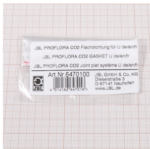
JBL PF CO2 плоское уплотнение для U