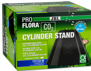
JBL PROFLORA CO2 CYLINDER STAND Подставка для баллонов CO2 500 г