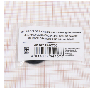
JBL PF CO2 INLINE набор уплотнений