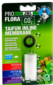
JBL PROFLORA CO2 TAIFUN INLINE MEMBRANE

Сменная мембрана для диффузора CO2 TAIFUN INLINE