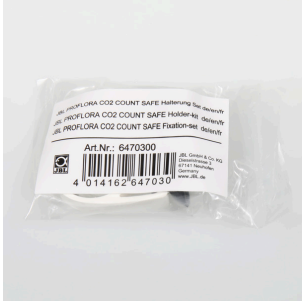
JBL PF CO2 COUNT SAFE крепление в компл.