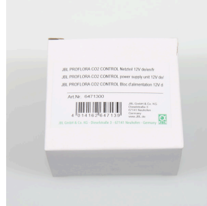
JBL PF CO2 CONTROL блок питания 12 В