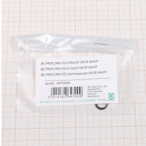
JBL PF CO2 уплотн. кольцо для VALVE