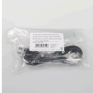
JBL PF CO2 CONTROL кабель для VALVE