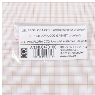
JBL PF CO2 плоское уплотнение для U