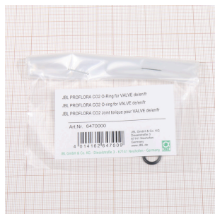
JBL PF CO2 уплотн. кольцо для VALVE