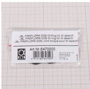
JBL PROFLORA CO2 уплотн. кольцо для M