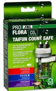
JBL PROFLORA CO2 TAIFUN COUNT SAFE Счетчик пузырьков CO2 со встроенным обратным клапаном