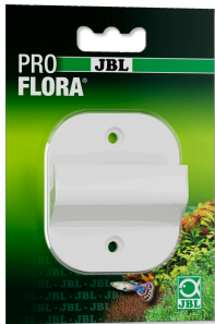
JBL PROFLORA CO2 CYLINDER WALLMOUNT Настенное крепление для баллонов CO2 с фикс. скобой