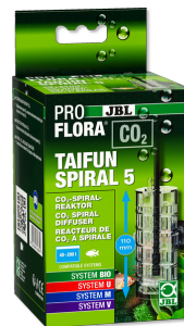
JBL PROFLORA CO2 TAIFUN SPIRAL 5 Нарастиваемый реактор CO2 для пресн. аквариумов 200 л