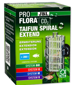
JBL PROFLORA CO2 TAIFUN SPIRAL EXTEND Расширение для JBL PROFLORA CO2 TAIFUN SPIRAL 5 / 10