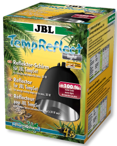
JBL TempReflect light Рефлектор для энергосберегающих ламп