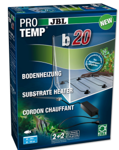
JBL PROTEMP b III Грунтовый термокабель для пресноводных аквариумов