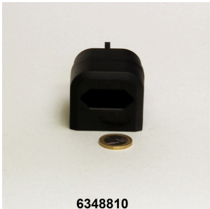
JBL adapter UK for all flat-pin plugs