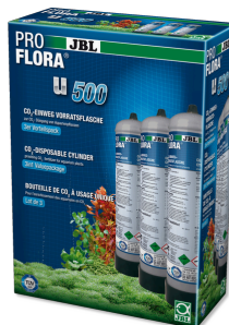
JBL PROFLORA 3 x u500 Сменный одноразовый CO2 баллон