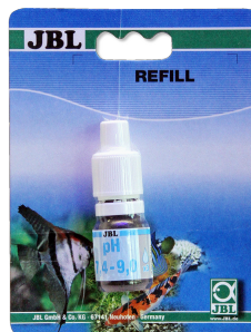
JBL pH 7,4-9,0 тест Тест pH в диапазоне 7,4-9,0 для аквариумов и прудов