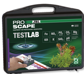
JBL Testlab ProScape Чемоданчик с тестами для растительных аквариумов