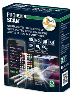
JBL PROSCAN Тестирование воды с помощью смартфона