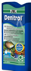
JBL Denitrol Стартовые бактерии для подселения аквариумных рыб