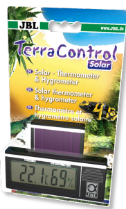
JBL TerraControl Solar Термометр и гигрометр для любых террариумов