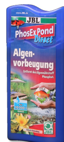
JBL PhosEx Pond Direct Средство для устранения фосфатов из прудовой воды