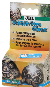
JBL Средство для ухода за панцирем у черепах

Препарат для ухода за панцирем сухопутных черепах