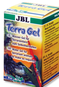
JBL TerraGel Водный гель для террариумных животных

Препарат для ухода за панцирем сухопутных черепах