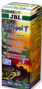
JBL Biotopol 7 Кондиционер для террариумов