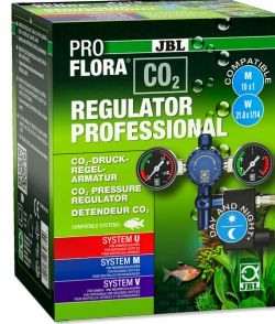
JBL PROFLORA CO2 REGULATOR PROFESSIONAL CO2 için 2 gösterg. ve solen. valfli basınç regülatörü