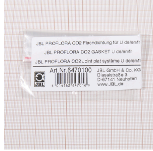
JBL PF CO2, U için düz conta