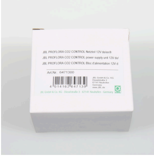
JBL PF CO2 CONTROL güç adaptörü 12V