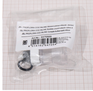
JBL PF CO2 INLINE kabarcık say.+geri akış önleyici

CO2 TAIFUN INLINE difüzörü için yedek membran