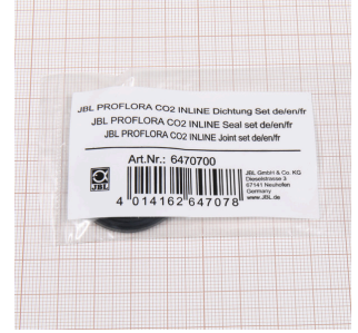
JBL PF CO2 INLINE conta seti