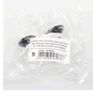
JBL PF CO2 INLINE askı seti