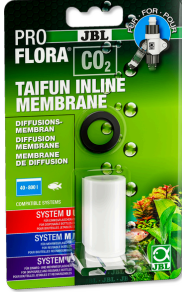
JBL PROFLORA CO2 TAIFUN INLINE MEMBRANE

CO2 TAIFUN INLINE difüzörü için yedek membran