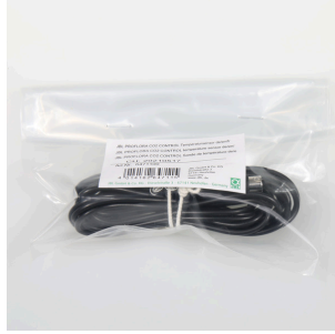
JBL PF CO2 CONTROL sıcaklık sensörü