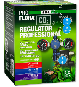
JBL PROFLORA CO2 REGULATOR PROFESSIONAL CO2 için 2 gösterg. ve solen. valfli basınç regülatörü