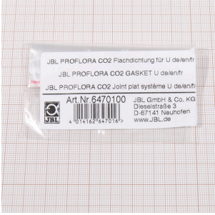
JBL PF CO2, U için düz conta