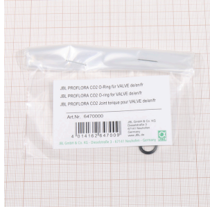
JBL PF CO2 VALVE için O-halka