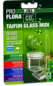
JBL PROFLORA CO2 TAIFUN GLASS 40-300 l'lik tatlı su akvaryml. için cam CO2 difüzörü