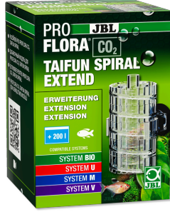
JBL PROFLORA CO2 TAIFUN SPIRAL EXTEND JBL PROFLORA CO2 TAIFUN SPIRAL 5 / 10 için genişletme