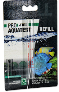
JBL PROAQUATEST K hortum