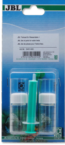
Su testleri için JBL parça seti