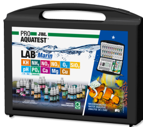
JBL PROAQUATEST LAB Marin Tuzlu su analizleri için profesyonel test seti