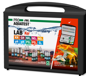
JBL PROAQUATEST LAB Koi Koi ve bahçe havuzu için profesyonel test çantası