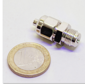
JBL hortum rakoru 4/6 basınç düşürücü