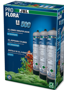
JBL PROFLORA 3 adet u500

Yeniden doldurulabilir 2 kg'lık CO2 besleme tüpü