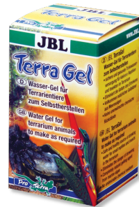
JBL TerraGel Teraryum hayvanları için su jeli