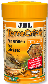
JBL TerraCrick Yemlik böcekler için tam yem