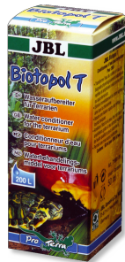
JBL Biotopol T Teraryumlar için su hazırlayıcı