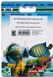
JBL geri akış önleyici Hava pompaları için çekvalf