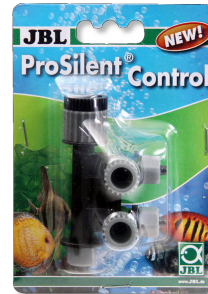
JBL ProSilent Control Ayarlanabilir hassas hava kesme musluğu