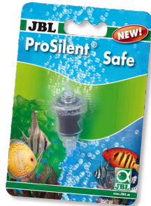
JBL ProSilent Safe Çek valf