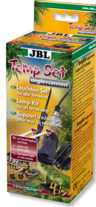
JBL TempSet dirsek+ bağlantı Teraryumlarda kull. spot lambalar için montaj seti