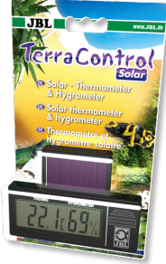
JBL TerraControl Solar Tüm teraryumlar için Solar termometre ve higrometre