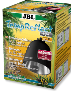
JBL TempReflect light Enerji etkin lambalar için reflektör kalkanı