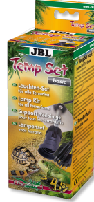
JBL TempSet basic Teraryumlarda kull. spot lambalar için montaj seti