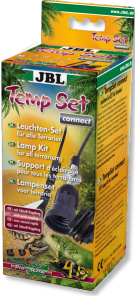
JBL TempSet connect Soket bağlantılı montaj seti