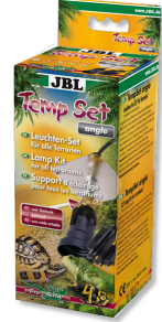
JBL TempSet dirsek Teraryumlarda kull. spot lambalar için montaj seti