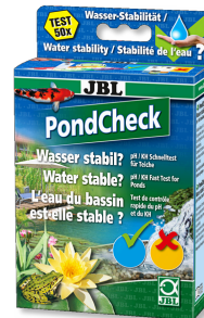
JBL PondCheck pH ve KS değerini belirlemek için hızlı test