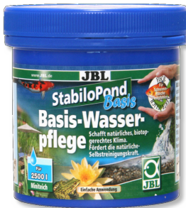
JBL StabiloPond basis Tüm bahçe havuzları için temel bakım ürünü