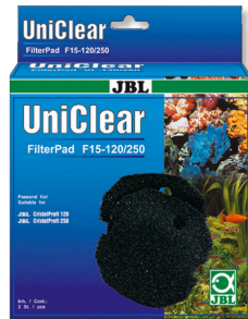
JBL FilterPad F15 CristalProfi akvaryum filtresi için kaba sünger