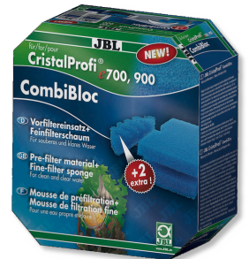
JBL CombiBloc CristalProfi e CristalProfi e için ön filtre elemanları ve sünger