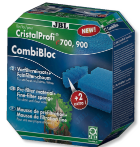
JBL CombiBloc CristalProfi e CristalProfi e için ön filtre elemanları ve sünger