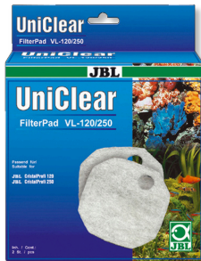
JBL FilterPad VL CristalProfi akv. filtresi için dokusuz kumaş pamuk