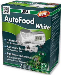
JBL AutoFood WHITE Akvaryum balıkları için beyaz yem otomati