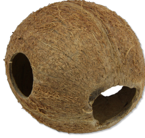
JBL Cocos Cava Akvaryumlar ve teraryumlar için Hindistan cevizi kovuk