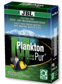
JBL PlanktonPur MEDIUM