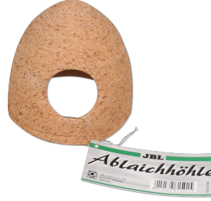
JBL Keramik Yumurtalama Mağarası Tatlı su akvaryumları için seramik kovuk