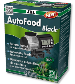
JBL AutoFood BLACK Akvaryum balıkları için siyah yem otomati