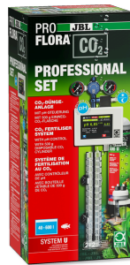
JBL PROFLORA CO2 PROFESSIONAL SET U Kit CO2 complet + contrôleur de CO2/pH