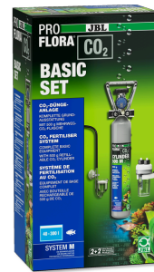
JBL PROFLORA CO2 BASIC SET M Kit CO2 de base complet pour plantes d'aquarium