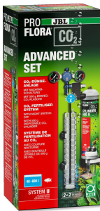
JBL PROFLORA CO2 ADVANCED SET U Kit complet de fertilisation au CO2 + coupure nocturne