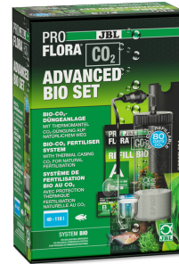
JBL PROFLORA CO2 ADVANCED BIO SET Kit bio CO2 pour aquariums d'eau douce de 40 à 110 l