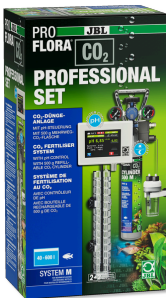
JBL PROFLORA CO2 PROFESSIONAL SET M Kit de fertilisation au CO2 avec régulateur de CO2