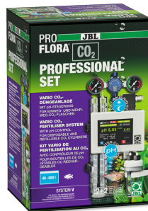
JBL PROFLORA CO2 PROFESSIONAL SET V Kit CO2 avec contrôleur de CO2 / SANS BOUTEILLE