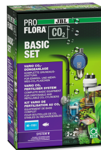
JBL PROFLORA CO2 BASIC SET V Kit CO2 pour plantes d'aquarium SANS BOUTEILLE