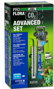
JBL PROFLORA CO2 ADVANCED SET M Kit complet de fertilisation au CO2 + coupure nocturne