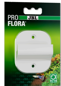
JBL PROFLORA CO2 CYLINDER WALLMOUNT Support pour bouteilles de CO2 avec étrier de sécurité