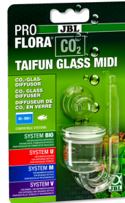
JBL PROFLORA CO2 TAIFUN GLASS Diffuseur de CO2 en verre pour aquarium de 40 à 300 l