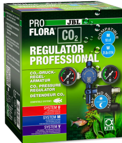
JBL PROFLORA CO2 REGULATOR PROFESSIONAL Détendeur pour CO2 avec 2 manomètres et électrovanne