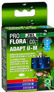
JBL PROFLORA CO2 ADAPT U - M Adaptateur bouteille jetable / bouteille rechargeable