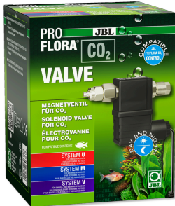
JBL PROFLORA CO2 VALVE Électrovanne de CO2 pour apport de CO2 contrôlé