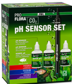
JBL PROFLORA CO2 pH SENSOR SET Électrode qualité labo pour appareils de pH