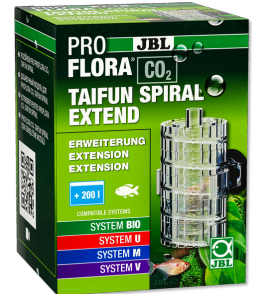
JBL PROFLORA CO2 TAIFUN SPIRAL EXTEND Extension pour JBL PROFLORA CO2 TAIFUN SPIRAL 5 / 10