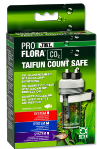
JBL PROFLORA CO2 TAIFUN COUNT SAFE Compte-bulles de CO2 avec clapet antiretour intégré