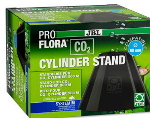
JBL PROFLORA CO2 CYLINDER STAND Pied pour bouteilles de 500 g de CO2