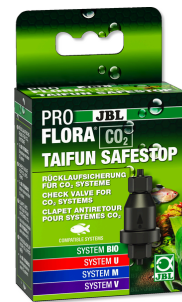
JBL PROFLORA CO2 TAIFUN SAFESTOP Clapet antiretour d'eau pour systèmes CO2