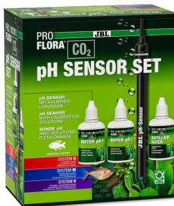
JBL PROFLORA CO2 pH SENSOR SET Électrode qualité labo pour appareils de pH