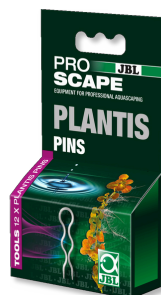
ÉPINGLES JBL PROSCAPE PLANTIS Épingles pour fixation des plantes en aquarium