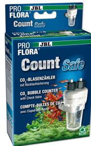
JBL PROFLORA CO2 Count Safe Compte-bulles de CO2 avec valve antiretour