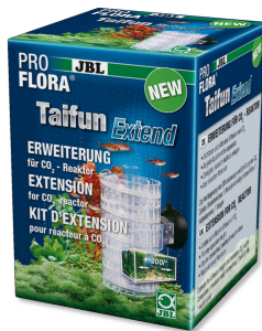
JBL PROFLORA Taifun Extend Extension pour réacteur à CO2 haute diffusion