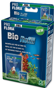
JBL PROFLORA BioRefill Recharge pour systèmes de fertilisation bio au CO2