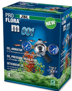
JBL PROFLORA m001 Détendeur pour réduction de pression