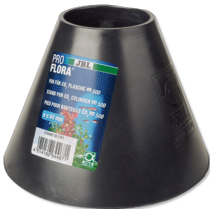
JBL ProFlora pied pour bouteille CO2 500g Pied pour bouteille de système de fertilisation au CO2